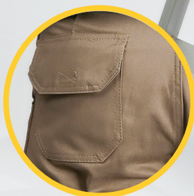
Tapa con velcro con bolsillo - fuelle