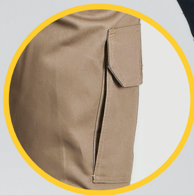
Bolsillos para requerimientos especiales