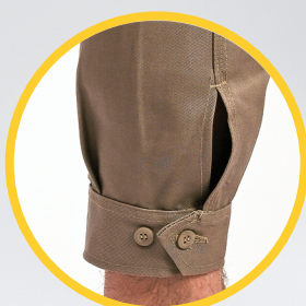
Botamangas con botón pasta