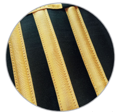
Ballenas, 4 para los talles chicos y 6 para los talles grandes.