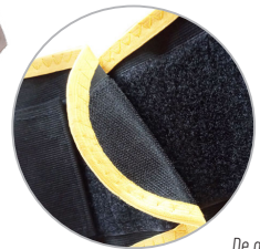
VELCROS De abrojo gancho.