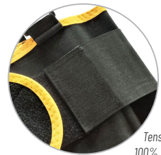
Tensores laterales 100% de elongación